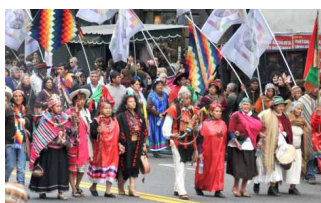
19 de abril: Día del Indio Americano