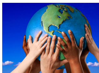
22 de abril: Día Internacional de la Tierra