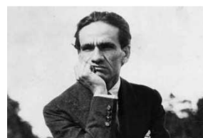
19 de mayo: Nacimiento del poeta César Vallejo