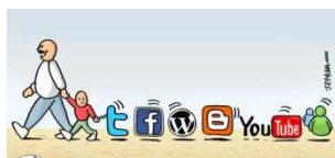
17 de mayo: Día mundial de las Telecomunicaciones