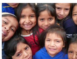
2º domingo de abril: Día del niño peruano