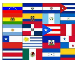
14 de abril: Día de las Américas