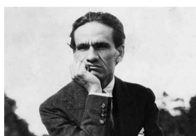
19 de mayo: Nacimiento del poeta César Vallejo