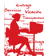
26 de abril: Día de las Secretarías