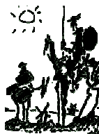
23 de abril: Día del Idioma Castellano – Día Mundial del Libro y Derecho de Autor