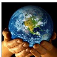
22 de abril: Día Internacional de la Tierra