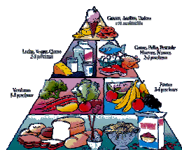
16 de octubre: Día Mundial de la alimentación