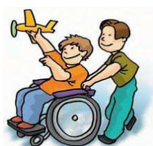
16 de octubre: Día del minusválido