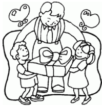
3er. domingo de junio: Día del Padre