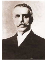
22 de junio: Fallecimiento de Manuel González Prada