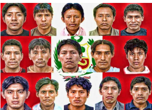
19 de abril: Día del Indio Americano