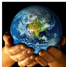
22 de abril: Día Internacional de la Tierra