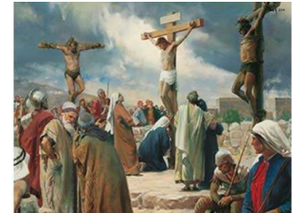
21 al 24 de abril: Semana Santa